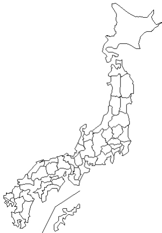
報告なし EV71 合計