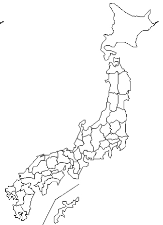
報告なし 無菌性髄膜炎