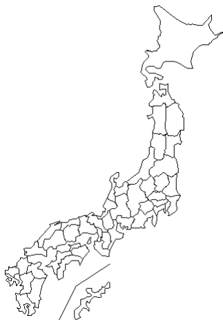
報告なし その他不明