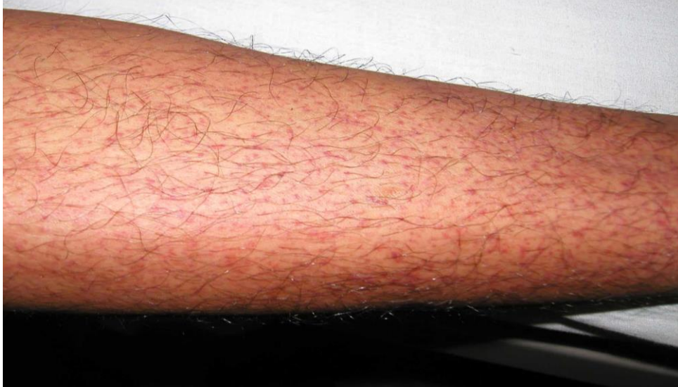
図 1. デング熱患者の発疹：解熱時期にみられた点状出血