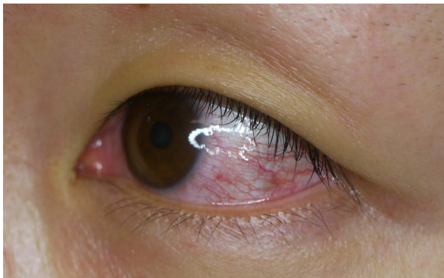
図4. ジカウイルス病の充血性結膜炎