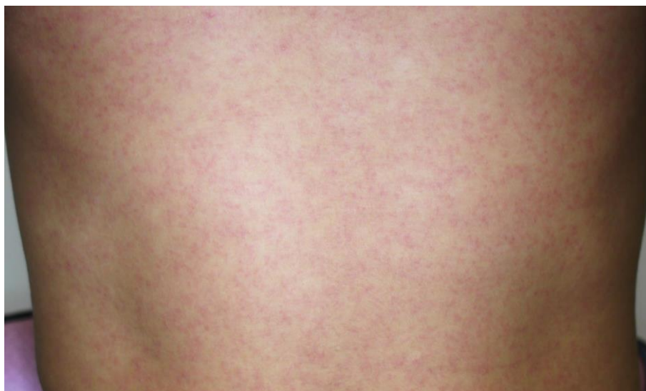
図3. ジカウイルス病の斑状丘疹様の発疹

潜伏期間は、2～12日（多くは2～7日）である。ジカウイルス病の臨床症状は多彩であるが、斑状丘疹様の発疹（ 図3 ）は90～100%に認められるのに対して、発熱の頻度は35～65%とされている 29,47 。また発疹は掻痒感を伴うことが多いとされている。また、大半の症例は入院を必要としなかった。 表7 に2015年のブラジル・リオデジャネイロにおけるジカウイルス病患者が発症後4日以内に認めた臨床症状を示す 47 。