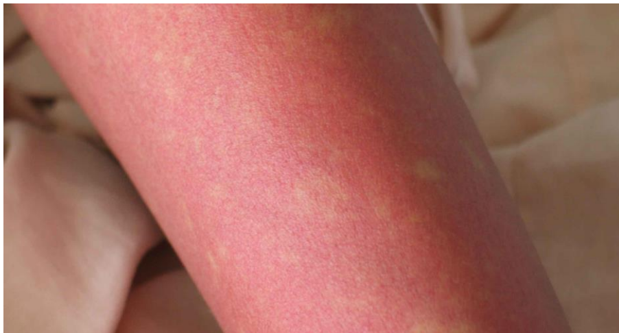
図 2. デング熱患者の発疹：解熱時期にみられた島状に白く抜ける紅斑