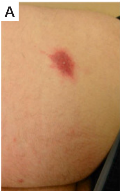
図 2-1 エムポックスの皮疹